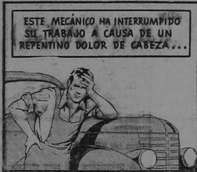
ESTE MECÁNICO HA INTERRUMPIDO SU TRABAJO A CAUSA DE UN REPENTINO DOLOR DE CABEZA...