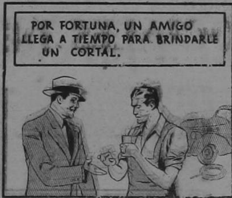
POR FORTUNA, UN AMIGO LLEGA A TIEMPO PARA BRINDARLE UN CORTAL.