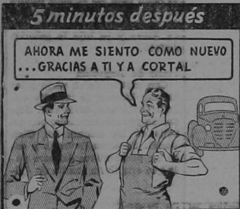
5 minutos después AHORA ME SIENTO COMO NUEVO... GRACIAS A TI YA CORTAL